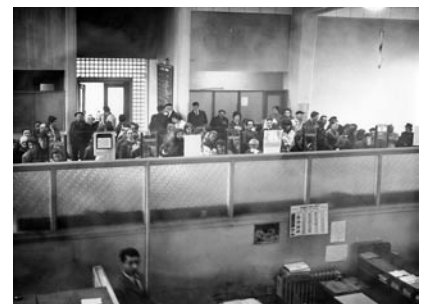
Des longues files d'attente dans d'austères locaux, jusqu'au sourire accueillant de nos hotesses, plus de 40 années se sont écoulées...